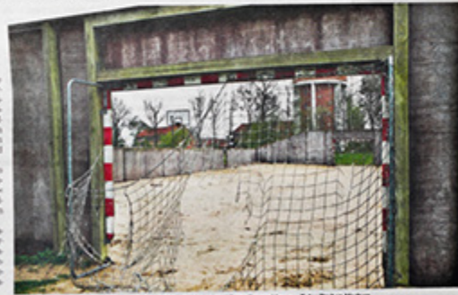
En mål og målstøtte håndballe skal stå til fordel for en multibane i Sønderby.

Idret og leg Arbejdet er »Multibane med plads til alle«. Placeringen er under udvælgelse. Som de ser ud fra, rummer de en multibane med kunstgræs, en arena til håndbold, en parkourbane, en løbestræk og badminton og diverse lege-