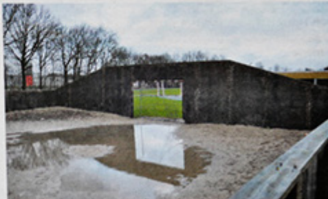
»Fra mulderful til træningsanlæg kaller initiativgruppen meget betegnende sin kampagne.

Du kan købe en elektronisk kopi af billeder bragt i Folkebladet og på www.viborgfolkeblad.dk . Hvis de er taget af Viborg Stifts Folkeblads egne fotografer Preben Madsen og Morten Dueholm, Billederne sælges på www.spotted.viborg-folkeblad.dk . Bemærk, at billederne er behøvet med copyright og kun sælges til privat brug.