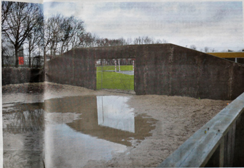
En særdeles nedbøt bandedbane skal væk til fordel for en multibane.

14 dage har initiativgruppen sat af til at drille bolden over strengen.