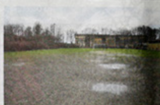
Det med mudderhullet er ikke en overdrivelse.

GIV DIG SELV OG DINE BØRN NOGLE HELT NYE OPLEVELSER